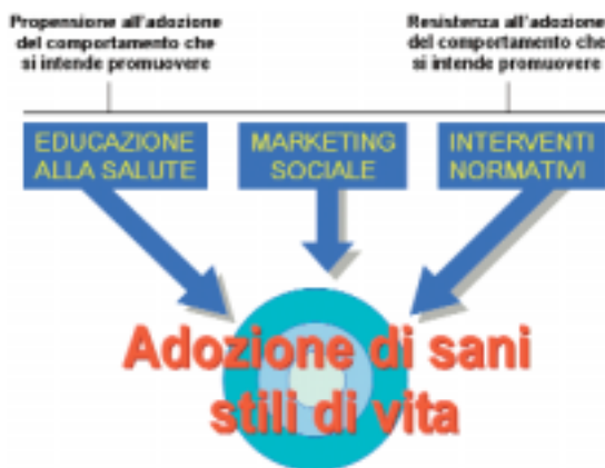
Figura 1. La scelta di quali strumenti di promozione della salute utilizzare è in funzione dell'attitudine della popolazione target a modificare il proprio comportamento.

Rispetto alla possibilità di orientare i comportamenti, l'educazione alla salute, il marketing sociale e gli interventi legislativi sono tra loro in rapporto di continuità (figura 1). Da un lato si pone l'educazione alla salute, che da sola è efficace quando i destinatari sono propensi all'adozione del comportamento che viene loro proposto perché il rapporto costo/beneficio percepito è favorevole. All'estremo opposto si collocano gli interventi legislativi. Il marketing sociale occupa una posizione intermedia ed agisce su fattori sociali, economici, ambientali e personali per creare condizioni favorevoli all'adozione di sani stili di vita.